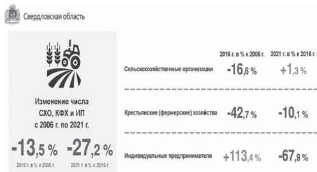
Рисунок 2 – Изменение числа СХО, КФХ и ИП Инфографика о количестве СХО, КФХ и ИП на территории Свердловской области (по состоянию на 1 августа 2021 года) доступна на официальном сайте Свердловскстата по адресу: https://sverdl.gks.ru/folder/32235 (раздел «Статистика» / «Официальная статистика» / «Свердловская область» / «Предпринимательство» / «Сельское хозяйство, охота и лесное хозяйство» / «Сельское хозяйство» / «Информационно-аналитические материалы, срочные публикации и комментарии»).

число СХО, КФХ и ИП постепенно снижается: в 2016 году оно снизилось на 13,5% (по отношению к 2006 году), а в 2021 году – на 27,2% (по отношению к 2016 году) (рисунок 2).