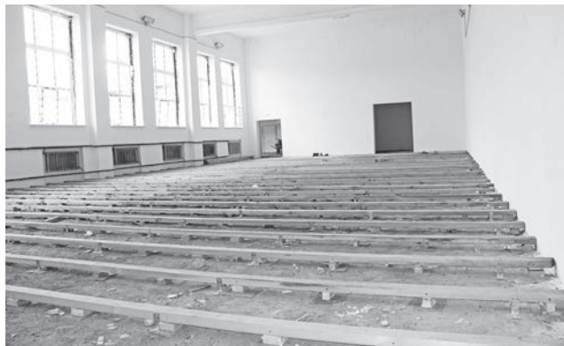
В Баженовской школе – «грандиозный и долгожданный» ремонт спортзала.

Байкаловская, Баженовская, Городищенская, Пелевинская и Ляпуновская школы пройдут проверку в августе.