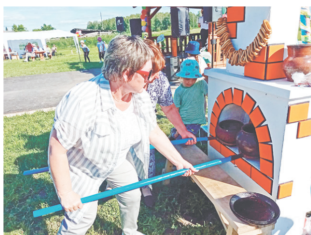
Интересные конкурсы привлекли многих.