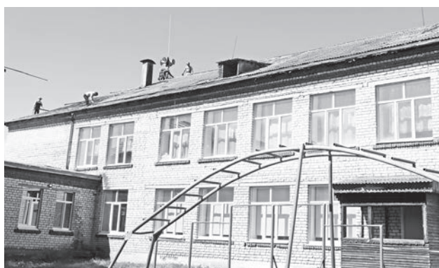
В Ляпуновской СОШ идёт капитальный ремонт крыши.