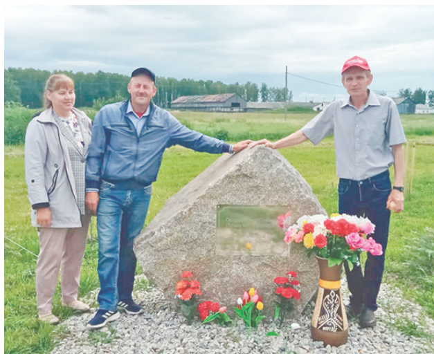
Не забыли и о погибших во время Великой Отечественной войны.