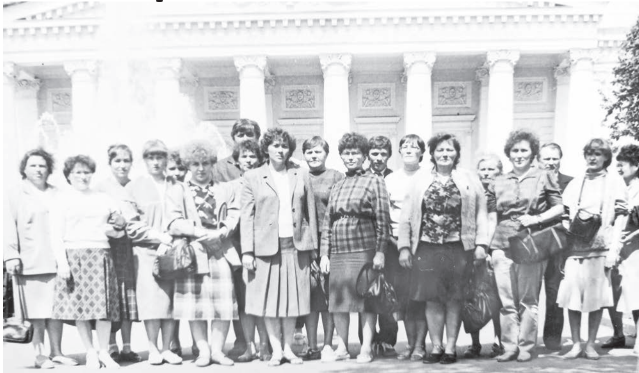
1989 год. Возле Большого театра.

ными магазинами. Ведь многие в Москву ехали впервые, да и дальше границ своего села не бывали.