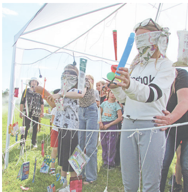
Дети с удовольствием участвовали в играх.