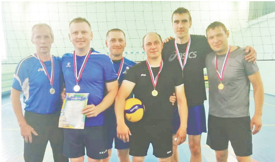
Сборная Байкалово была сильнее «Памира».