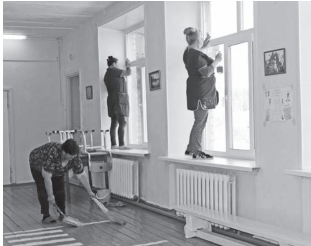
Во всех образовательных организациях проведены косметические ремонты.

Главные изменения ожидают Пелевинскую и Городищенскую школы. Здесь осенью планируется открыть образовательные центры естественно-научной и технологической направленности «Точка