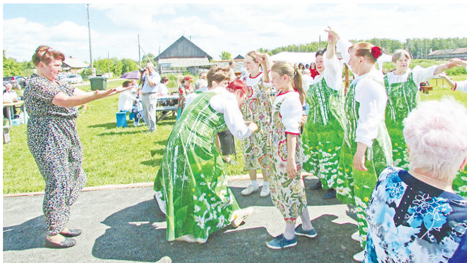
На юбилее были организованы народные игры и забавы.

На празднике было продумано всё: шары, баннер, скамейки покрашены, столы со скатертями, букеты из полевых цветов, шатры