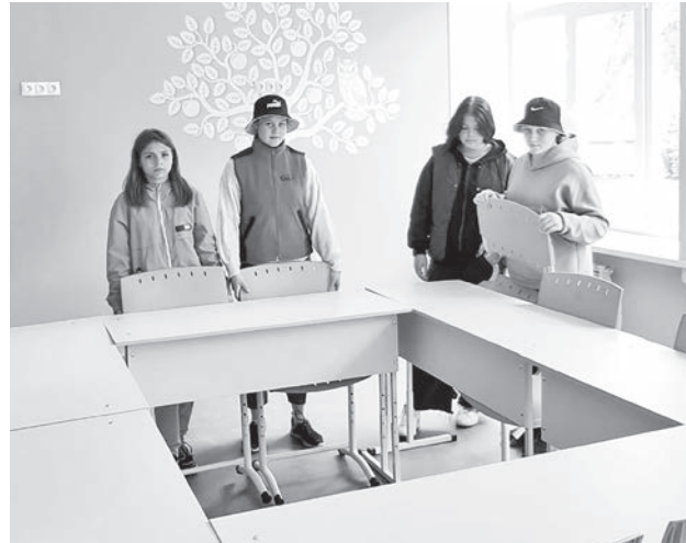
В «Точке роста» Пелевинской ООШ идёт установка мебели.

планируется обновление главного крыльца и замена входной группы парадного входа.