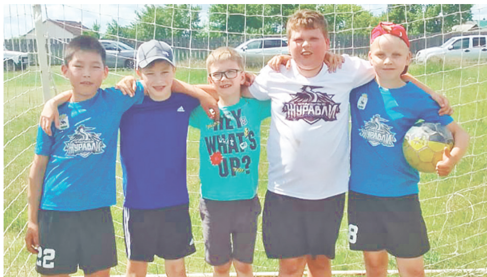
В младшей группе по футболу уверенную победу одержали «Стальные журавли».