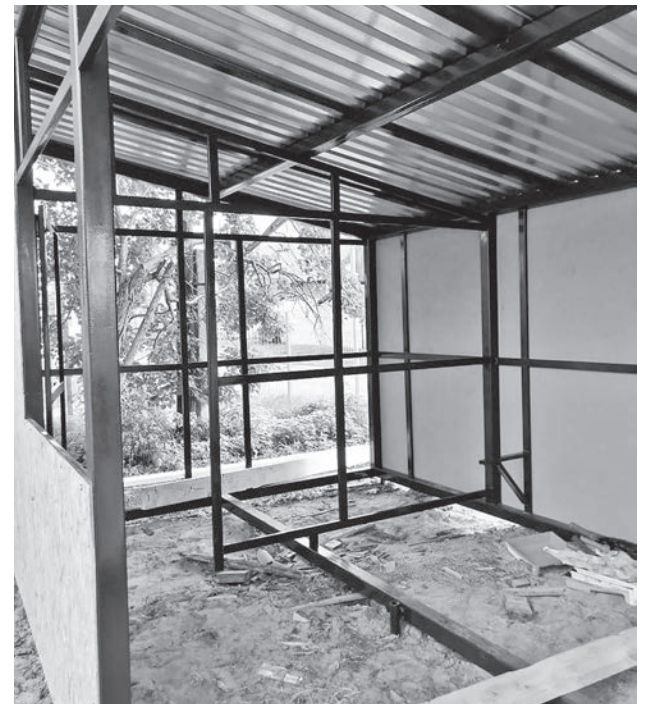
В Шадринском д/с идёт замена окон и строится уличная веранда.

Шадринском детском саду идёт замена старых деревянных окон на современные пластиковые. В некоторых д/с проведены ремонты ограждений и строительство уличных веранд. В Палецковском детском саду «Солнышко», кроме установки нового забора, отремонтированы два крыльца.